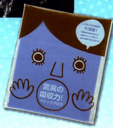
こぼれたジュースもサッと拭き取り